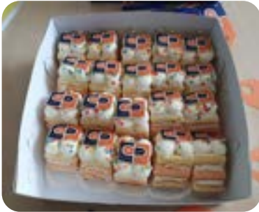
Een feestelijk tintje (of smaakje?) aan de afsluiting van de pilots ...

Voor de één is loslaten meer wennen dan voor de ander, maar de deelnemende teams concluderen: "We kunnen dit!" Binnen Interzorg hebben team De Brink van locatie Hendrik Kok te Rolde en wijkteam 2 te Assen vlak voor de zomervakantie hun pilots afgerond. Een aantal 'kernwoorden' uit de laatste werksessies: elkaar meenemen, bewustwording en vertrouwen in elkaar.